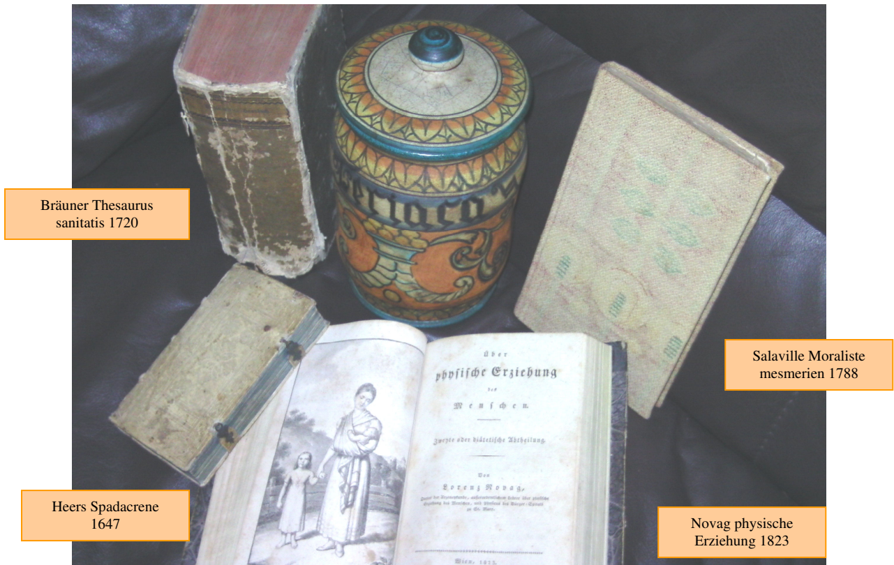
Deko: Theriak – teriaca – Gefäß vermutl. Venedig 17./18. Jahrhdt.